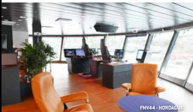
FMV44 - HORDAGUT

Større ombygginger kan være krevende, og om man ikke utfører et godt forarbeid samt løser utfordringer som oppstår underveis i prosjektet riktig, kan både penger og tid gå til spille. FMVs kompetanse innen FMV GoodFish, design/engineering, innkjøp og produksjon (eksempelvis innen stålbygging og elektro) bidrar til vellykkede ombygginger på Sveiseneset.