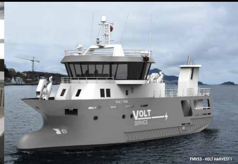
FMV53 - VOLT HARVEST I