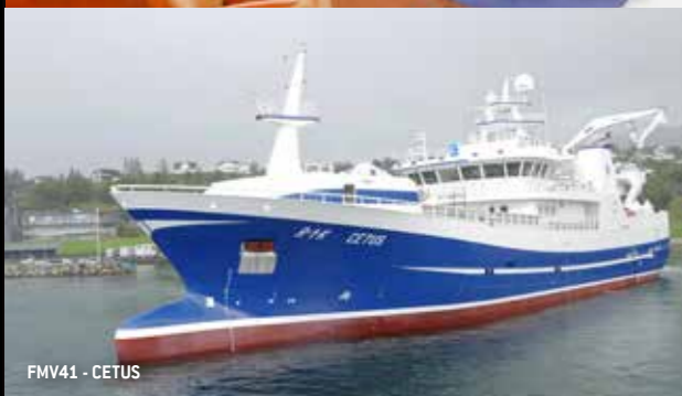
FMV41 - CETUS